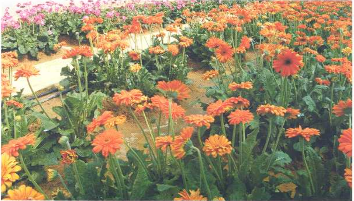
पॉलीहाउस में जरबेरा पुष्प उत्पादन

जरबेरा बहुवर्षीय कर्तित पुष्प वर्ग का पौधा है। इसकी उत्पत्ति स्थल अफ्रीका को माना जाता है। इसकी खेती अलंकृत बागवानी में सजावट एवं गुलदस्ता बनाने के लिए की जाती है। छोटी किस्म की प्रजातियों को गमलों में शोभाकारी किनारी के रूप में भी उगाया जाता है। इसके कर्तित पुष्प लगभग एक सप्ताह तक तरोताजा बने रहते हैं। इसकी लगभग 70 प्रजातियाँ हैं जिसमें 7 का उत्पत्ति स्थल भारत या आस पास का माना गया है। जरबेरा की खेती विश्व में नीदरलैण्ड, इटली, पोलैण्ड, इज़रायल और कोलम्बिया में की जा रही है। भारत में इसकी खेती बंगलोर एवं पूणे में व्यवसायिक स्तर पर घरेलू बाजार में बेचने हेतु की जा रही है। पहाड़ी राज्यों में इसकी खेती व्यवसाय के तौर पर शुरुआती दौर में है। घरेलू पुष्प बाजारों में जरबेरा कट फ्लावर की मांग दिन-प्रतिदिन बढ़ती जा रही है। इसके प्रजातियों को सिंगल, सेमी डब्ल और डब्ल वर्गों में विभाजित किया गया है। जरबेरा कट फ्लावर व्यवसाय में डब्ल प्रजातियों की मांग सर्वाधिक है।