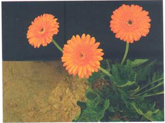
जरबेरा पुष्प काटने के लिए तैयार

गुणवत्ता युक्त पुष्प उत्पादन पौध रोपण के 5 से 6 महीने बाद शुरू हो जाता है। जरबेरा का फूल जब पूर्ण रूप से खिल जाए, उसी दिन उन पुष्पों की कटाई कर लेनी चाहिए। यदि फूलों को काटने की सही अवस्था से पहले काट दिया गया, तो फूलों का रंग एवं आकार भली भांति विकसित नहीं हो पाता है तथा यदि खिले फूलों को बिलम्ब करके काटा गया तो फूल की गुणवत्ता घट जाती है। काटने के बाद फूलों की डण्डियों को तुरन्त पानी भरे बाल्टी में रखना चाहिए। जरबेरा पुष्प की