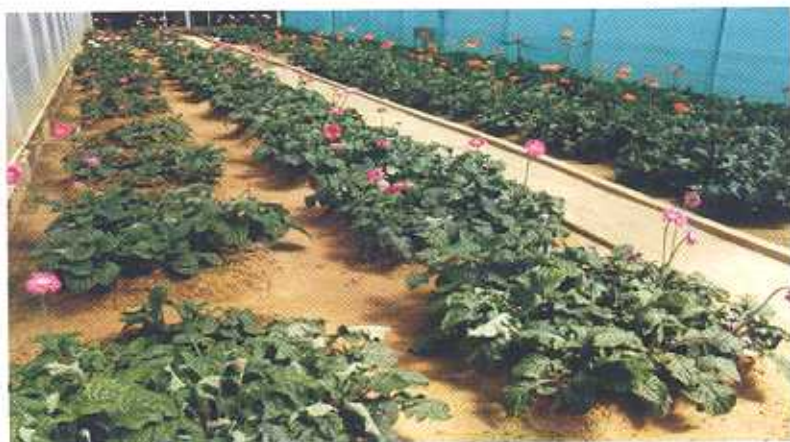
जरबेरा के मातृ पौधे कलम्प विभाजन हेतु तैयार

पहाड़ी क्षेत्रों में जरबेरा के कलम्प का विभाजन सितम्बर के पहले सप्ताह तथा मैदानी क्षेत्रों में जून से जुलाई में किया जाता है। कलम्प विभाजन के बाद तथा पुनः कलम्प को रोपित करने से पहले कलम्प से कुछ पत्तों के उपरी आधे हिस्से को काट देना चाहिए। केवल दो से तीन नये पत्ते रखे जाते हैं। कलम्प को