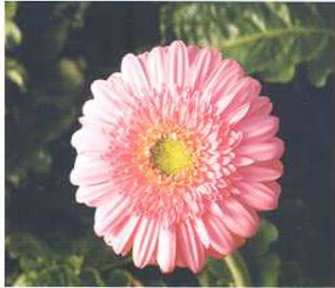
जरबेरा की विभिन्न प्रजातियाँ