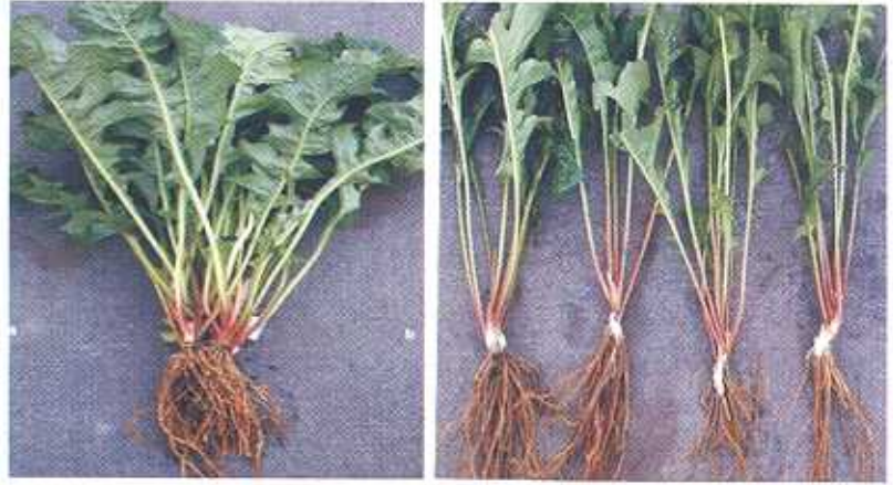
जरबेरा का कलम्प विभाजन द्वारा प्रवर्धन

सेंटीग्रेड तथा आर्द्रता 80 प्रतिशत तक हो, वहाँ पर रखनी चाहिए। इस विधि द्वारा 15-20 दिनों में पौधे क्यारी में स्थानान्तरण के लिए तैयार हो जाते हैं। पौध रोपण के तुरन्त बाद जो फूल आते हैं, उन्हें शुरु में तोड़ देते हैं। जब तक पौधे पर कम से कम 6-7 बड़ी आकार की पत्तियाँ न हों जाएं तब तक पुष्प उत्पादन नहीं किया जाता है।